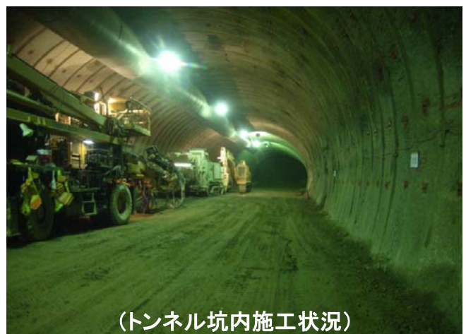
(トンネル坑内施工状況)