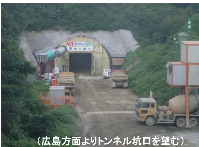
(広島方面よりトンネル坑口を望む)