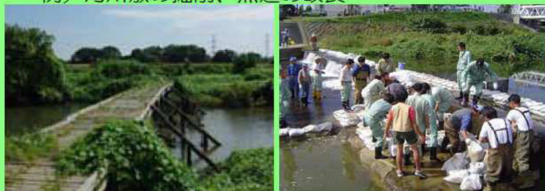
ピオトープの整備