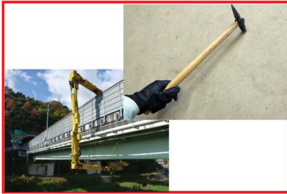
写真-1 橋の点検（イメージ）

基本的には橋やトンネルに近づいて見たり、写真のようにハンマーで叩いたときの音を聞いて損傷箇所を探します。