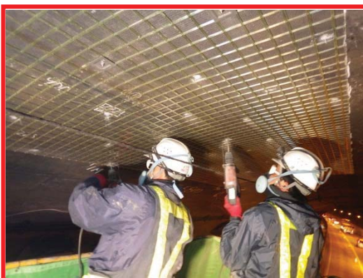
写真-2 トンネル補修（イメージ）

損傷箇所には、どのような処置が必要かを検討した後に、補修を行います。損傷箇所には写真のようなネット等を張り、長く利用できるようにします。