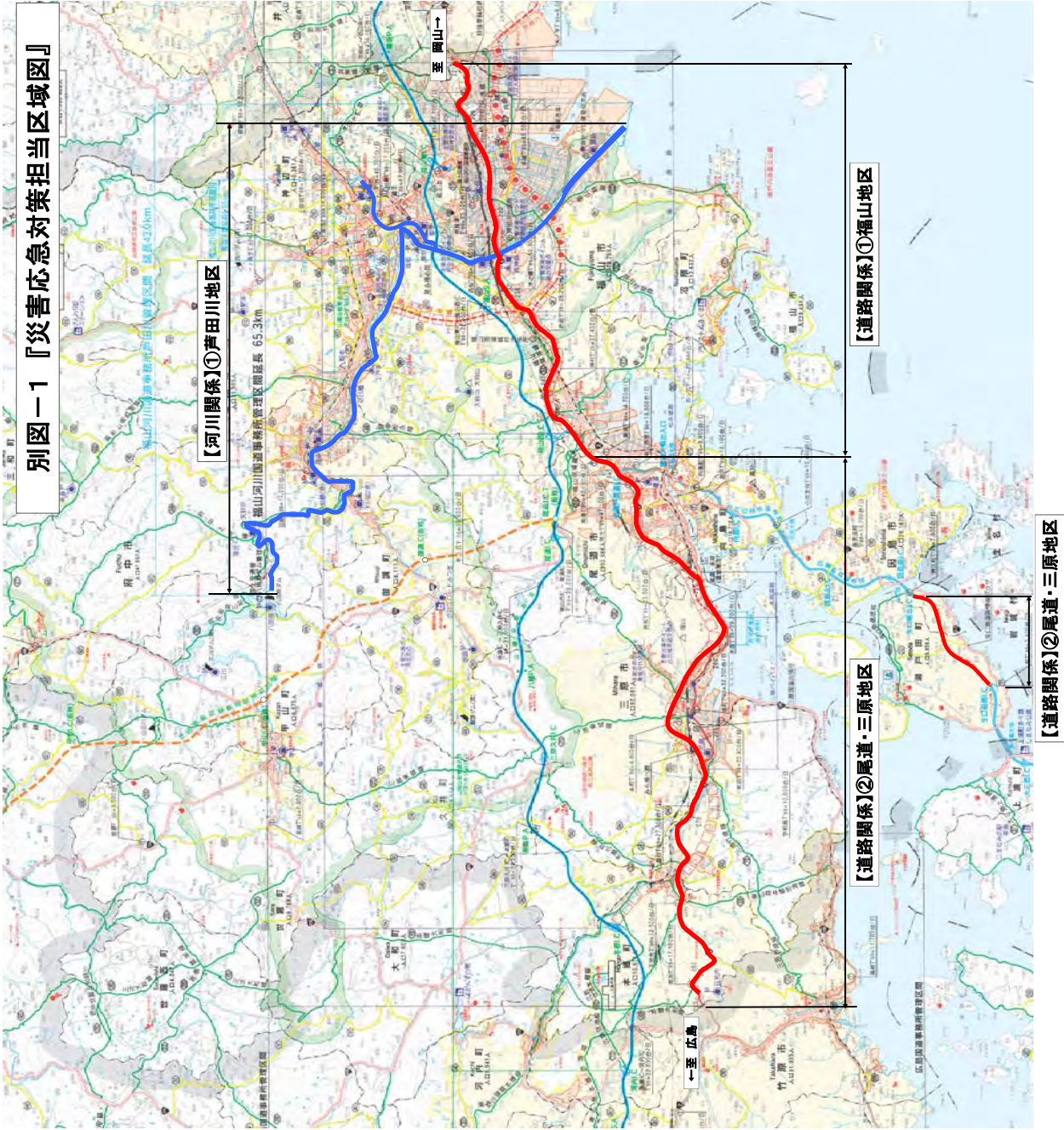
別図-1 『災害応急対策担当区域図』