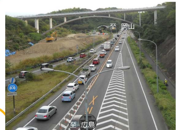
【写真】2車線区間の渋滞状況