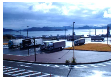
大型車駐車エリア