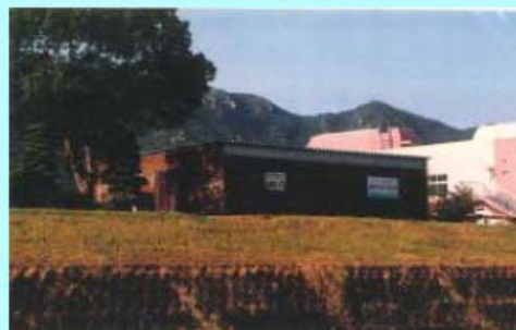
市民団体による活動拠点の整備事例(佐波川)