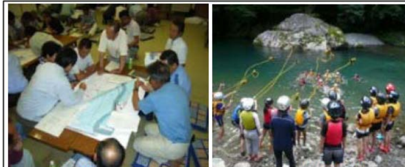
マイ防災マップづくり