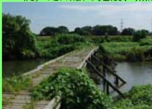
ビオトープの整備