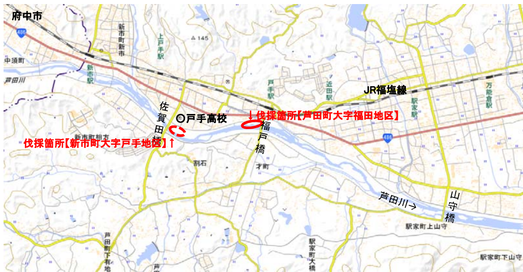
現地伐採箇所の状況(8月上旬)