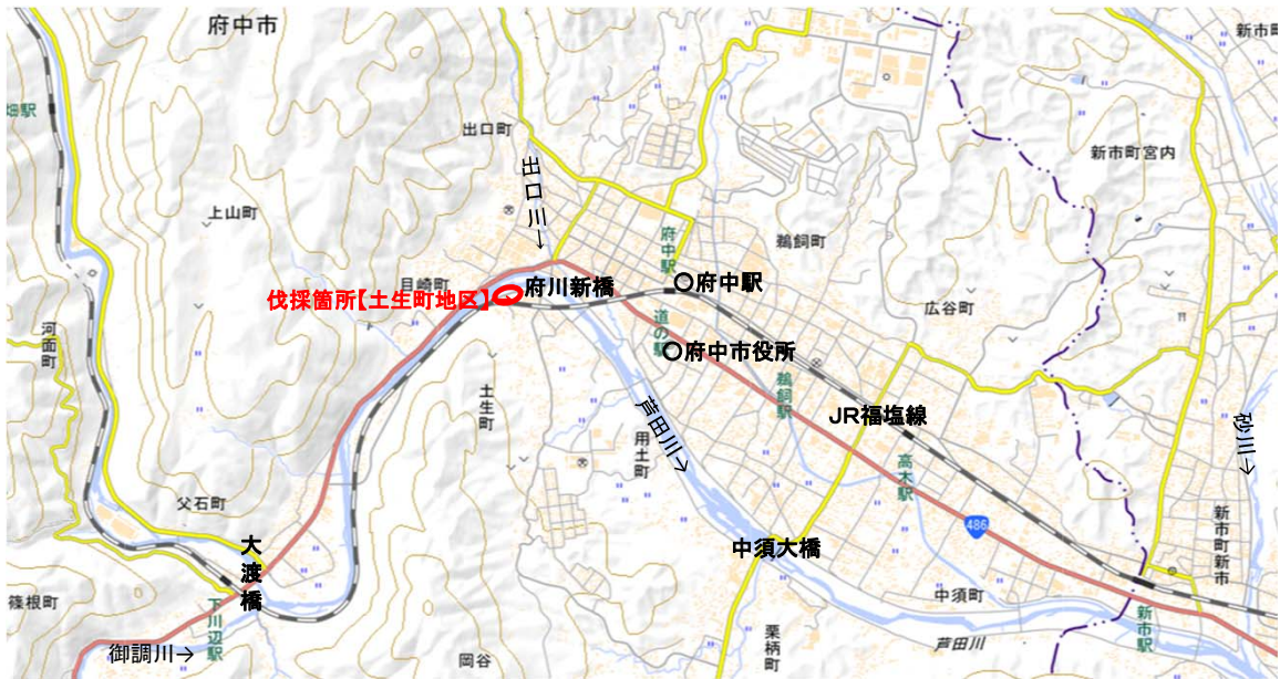
現地伐採箇所の状況(7月下旬)