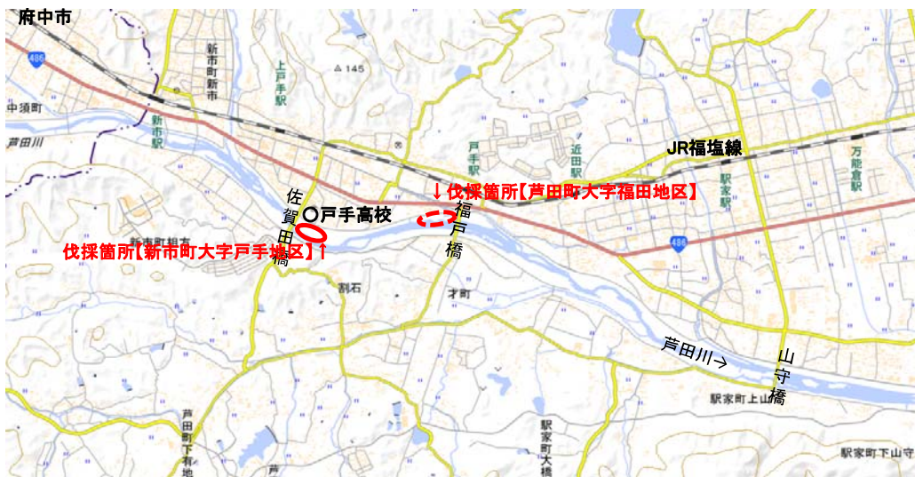
現地伐採箇所の状況(8月上旬)