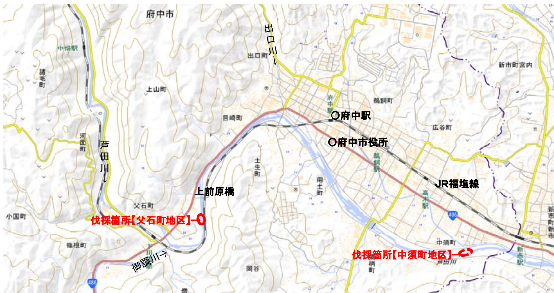
現地伐採箇所の状況(8月上旬)