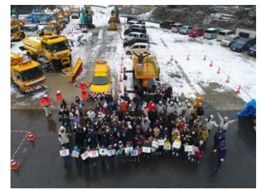
ドローンによる記念撮影

※荒天などで中止する場合の連絡やヘルメット準備のため 取材の場合は、事前に〈お問い合わせ先〉までご連絡下さい。