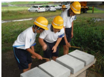
コンクリート打音検査