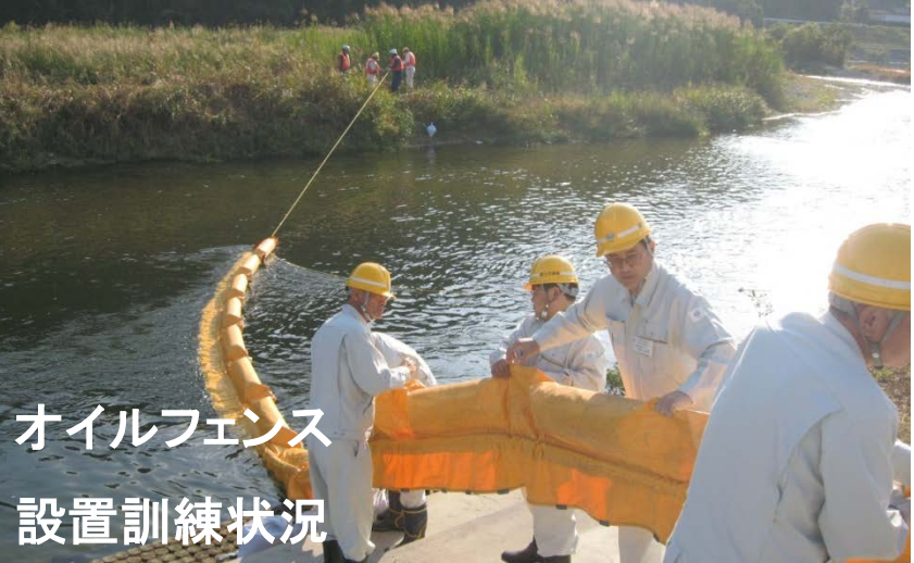
オイルフェンス 設置訓練状況