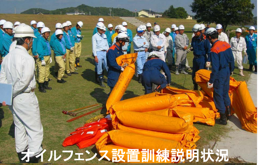
オイルフェンス設置訓練説明状況