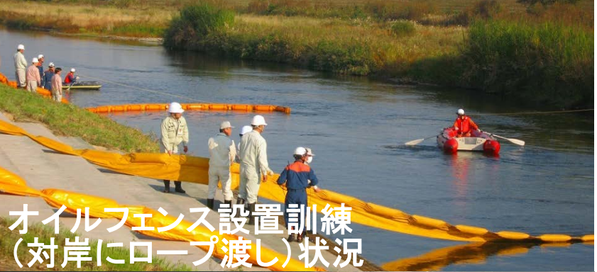
オイルフェンス設置訓練 (対岸にロープ渡し)状況