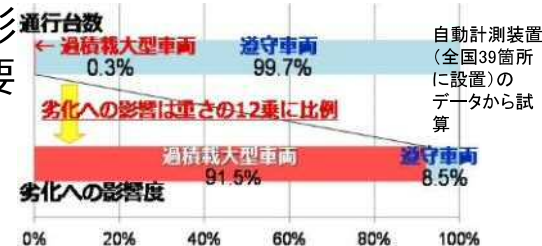
【図 道路橋の劣化に与える影響】

基準の2倍以上の重量超過の悪質違反者に厳罰化⇒現地取締りで違反を確認した場合は告発(レッドカード)