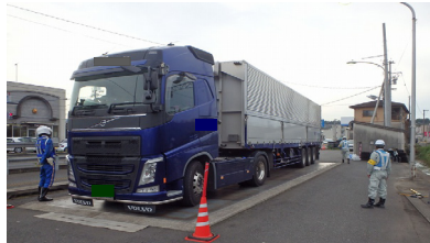
車両重量計測状況