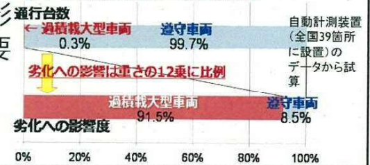
【図 道路橋の劣化に与える影響】