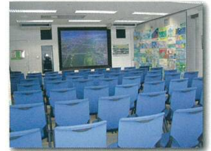
せんじょうせつごうしつ ⑤見学説明室 ※レイアウト変更適宜有り

芦田川の概要や高屋川浄化施設の説明、バックテスト体験を必要に応じて行っています。