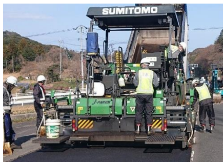
舗装材の敷ならし