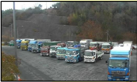
大型車駐車状況(平日)