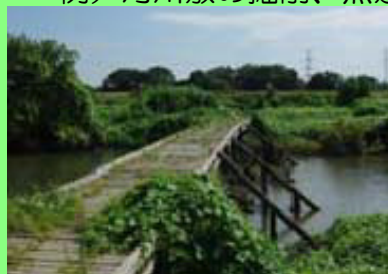
ピオトープの整備