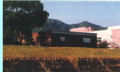
市民団体による活動拠点の整備事例（佐波川）

※ 河川管理者から河川管理施設の維持、除草等の委託を受けることも可能となります。委託先については、公募等の適正な手続きを経て選定を行う予定です。