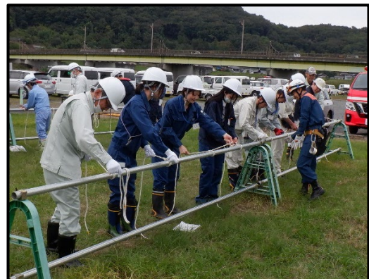
ロープワーク訓練