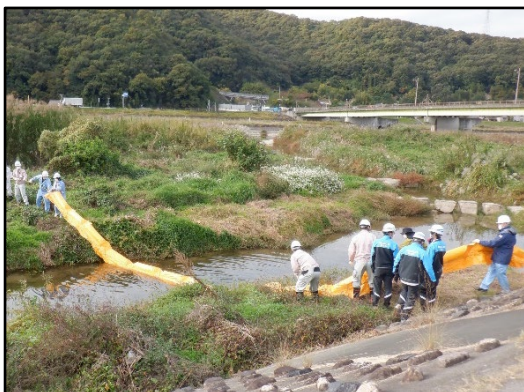
オイルフェンス展張訓練