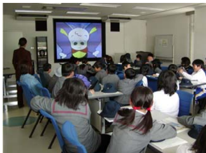
写真 6-3-1 芦田川見る視る館での子供学習

国全体の施策や方向に関するものから、生活に密着した防災、環境問題までバラエティに富んだ講座を「出前講座」として用意し、河川に関する学習を今後も支援します。