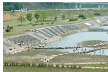
写真 6-4-1 ちゃぷちやぷらんど (福山市)

芦田川では、子どもたちが水遊びできる浅瀬や散歩道等の整備の要望と提案が住民から行われ、福山市と協力して河川公園「ちゃぷちやぷらんど」を整備しました。この河川公園は、水との触れ合いにより水質浄化意識を高めようと、環境学習や水辺に近づく親水空間として位置付けられています。公園の清掃や草刈り等の維持管理は市民団体が実施しています。