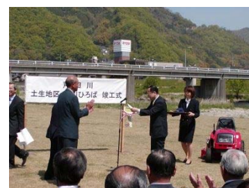
写真 6-4-2 土生地区環境整備事業の竣工式 (府中市)

また、府中市の POM 子供の国や土生地区では、地元市民が主体となって河川敷の清掃等の維持管理を実施しています。