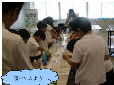
パックテスト（簡易水質試験）体験