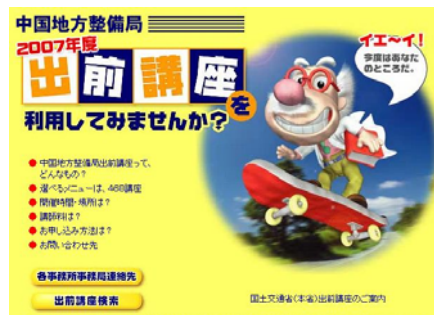
図 6-3-1 出前講座の案内