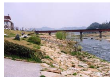
写真 6-4-3 POM 子供の国の河川広場 (府中市)

今後も、河川の特長や地域のニーズを反映させた河川整備の実現を目指すために、地域住民からの要望や意見を聴きながら、その意見を踏まえて整備に取り組みます。また、適正な河川管理を行っていく上で、地元自治体や地域住民、NPO 等の参画を推進し、役割分担をしながら、連携・協働の体制を強化します。