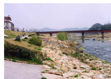
写真 6-4-3 POM子供の国の河川広場 (府中市)