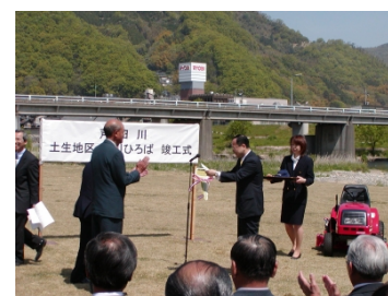
写真 6-4-2 土生地区環境整備事業の竣工式 (府中市)