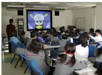
写真 6-3-1 芦田川見る視る館での子供学習

国全体の施策や方向に関するものから、生活に密着した防災、環境問題までバラエティに富んだ講座を「出前講座」として用意し、河川に関する学習を今後も支援します。