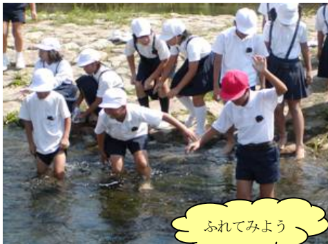
浄化後の水にふれて

河川広報室「 み 芦田川 み 見る る 視る 館 」は、地域の方々が芦田川の水質、生物、浄化施設等に関する広報活動を通じて「川の大切さ」を再認識し、行政の行う取り組みへの理解を深めてもらおうと同時に、家庭でできる水質改善の取り組みについて啓発活動を行っています。今後も、この広報室を通じて、もっと芦田川のことを知ってもらうために、浄化施設の案内、パネルや水槽、模型等の展示等により、情報発信を行います。