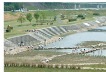
写真 6-4-1 ちゃぷちゃぷらんど (福山市)

今後も、河川の特長や地域のニーズを反映させた河川整備の実現を目指すために、地域住民からの要望や意見を聴きながら、その意見を踏まえて整備に取り組みます。また、適正な河川管理を行っていく上で、地元自治体や地域住民、NPO等の参画を推進し、役割分担をしながら、連携・協働の体制を強化します。