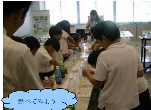
パックテスト（簡易水質試験）体験