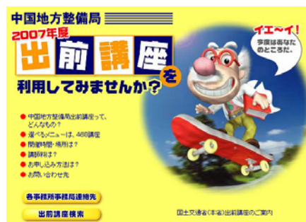
図 6-3-1 出前講座の案内