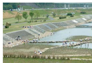
写真 6-4-1 ちゃぷちやぷらんど (福山市)

今後も、河川の特長や地域のニーズを反映させた河川整備の実現を目指すために、地域住民からの要望や意見を聴きながら、その意見を踏まえて整備に取り組みます。また、適正な河川管理を行っていく上で、地元自治体や地域住民、NPO 等の参画を推進し、役割分担をしながら、連携・協働の体制を強化します。