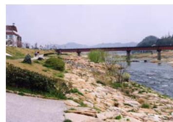
写真 6-4-3 府中市こどもの国 ポムポムの河川広場