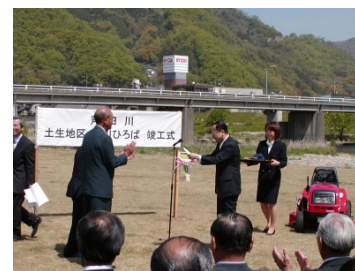
写真 6-4-2 土生地区環境整備事業 の竣工式（府中市）