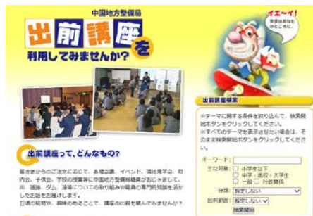
図 6-3-1 出前講座の案内

国全体の施策や方向に関するものから、生活に密着した防災、環境問題までバラエティに富んだ講座を「出前講座」として用意し、河川に関する学習を今後も支援します。