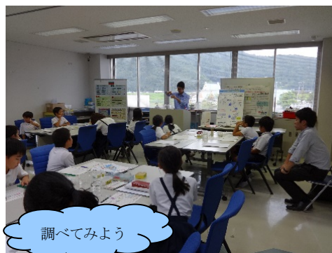
バックテスト（簡易水質試験）体験