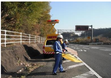
通常巡回（落下物処理）

道路を安全で快適に利用していただけるよう日々の道路パトロールや定期点検を行い、道路の欠陥・破損の早期発見と補修に努めています。また、道路の清掃や街路樹、照明施設などの日常的な管理を行っています。