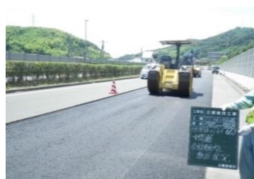
舗装修繕 (切削オーバーレイ工)