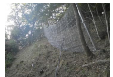
防災工事 (落石防止柵工)