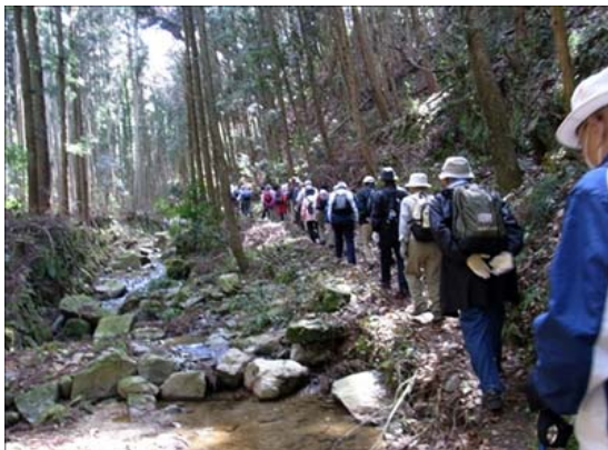
岩国往来ウォーク

また、長谷ほたる川の整備、三椏の植樹を実施するなど、歴史や自然環境の保全を通じて沿道地域の連携が図られ、地域活性化に寄与しています。