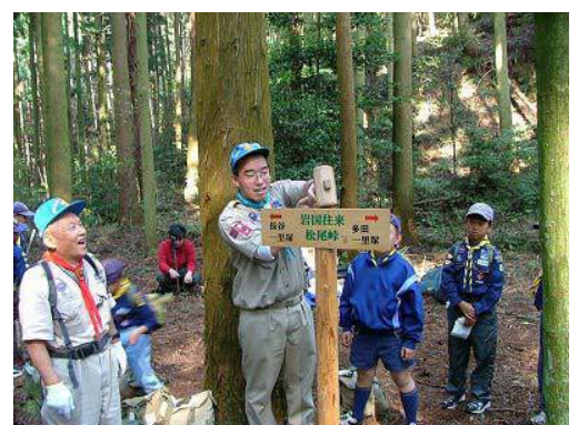
手づくり標識設置