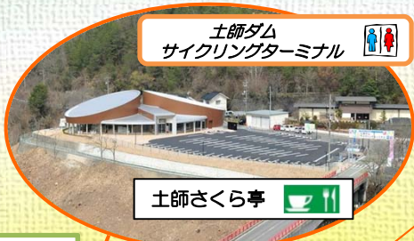
土師ダム サイクリングターミナル