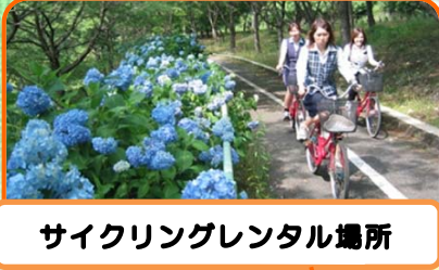
サイクリングレンタル場所