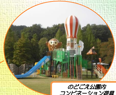
のどえ公園内 コンビネーション遊具