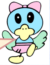
土師ダム非公認キャラクター はじまり子

土師ダム周辺は遊べる場所がたくさんあるよ！ ダム見学とあわせて寄ってみよう！！ イベント参加で、はじまり子からのレンタサイクル割引券プレゼントもあるよ。