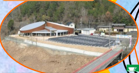
土師さくら亭(レストラン) ダムカレーは必須 レンタサイクル貸し出し受付 安芸高田のおみやげそろってる。