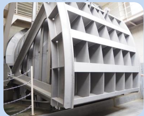
外のダムでは絶対に見られない 引張りラジアルゲート正面から見よう