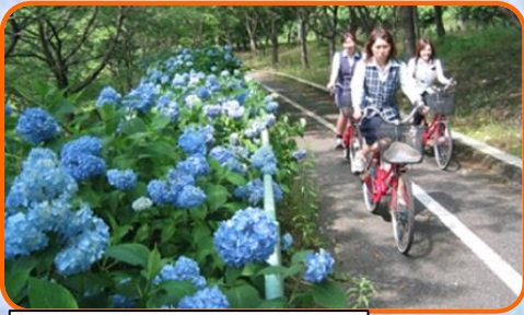
レンタサイクル ※あじさいはシカが食べました

土師ダム周辺は遊べる場所がたくさんあるよ！ ダム見学とあわせて寄ってみよう！！ イベント参加で、はじまり子からのレンタサイクル割引券プレゼントもあるよ。