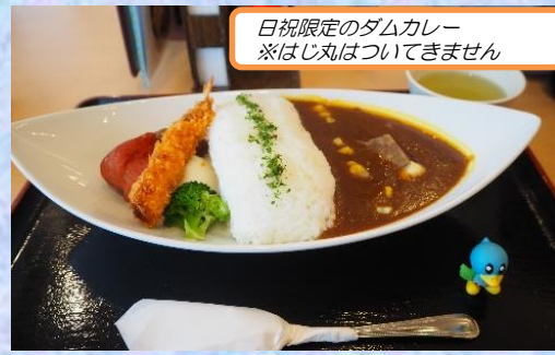
日祝限定のダムカレー ※はじ丸はついてきません