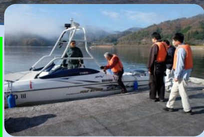
船に乗って出航だ！(約20分) (受付で整理券がもらえます 先着32人まで)

3つのダムクイズで待っているぞ クエスト1 ダム周辺の見どころに設置されたスタンプをゲット ダンジョンを巡り6個のスタンプを集める！ クエスト2 パネルに隠されたヒントから謎を解け ダムクイズ これが解けたらとりあえず土師ダムマニア クエスト3 土師ダムの隠されたヒミツわかる 激ムズクイズ 一問目から心が折れる…… おまけクイズ……はじ丸ぬりえ