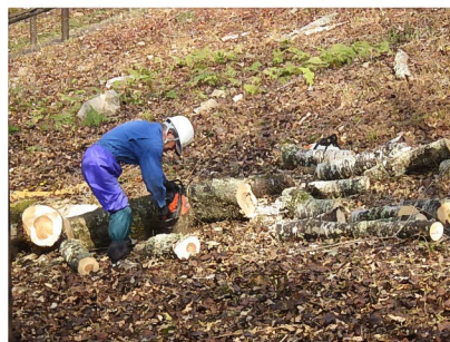
チェーンソーによる玉切り