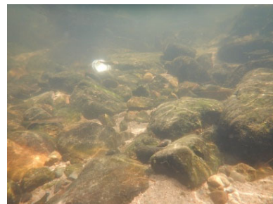
フラッシュ放流後