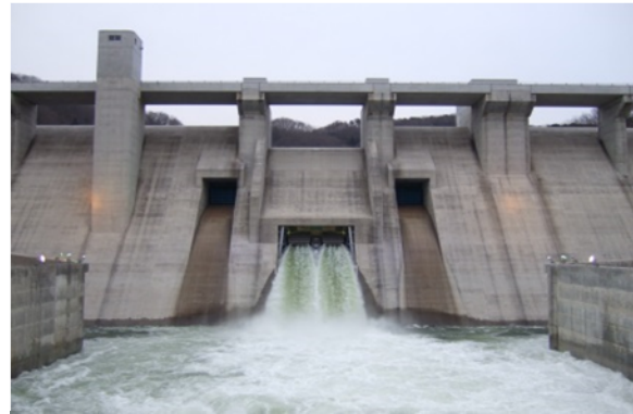
灰塚ダムフラッシュ放流状況

フラッシュ放流は、川の中にある石の表面を洗い流して、魚の餌となる付着藻類を剥離更新させるなどの河川環境改善を目的とした放流で、土師ダムでは平成15年度から、灰塚ダムでは平成18年度から実施しています。