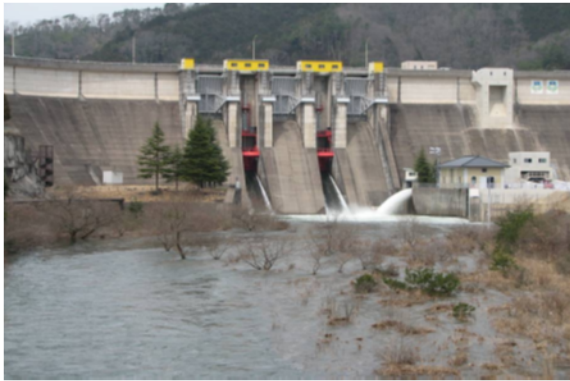
土師ダムフラッシュ放流状況