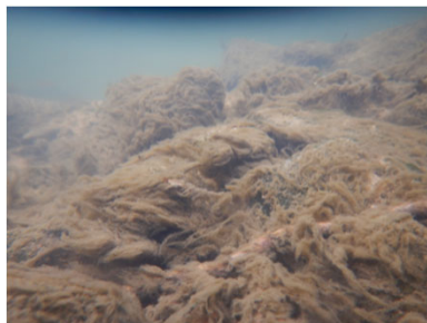
フラッシュ放流前