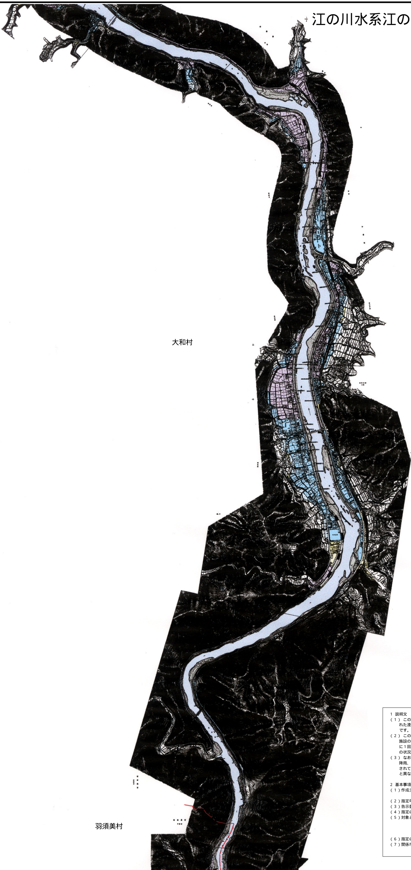
江の川水系江の川 浸水想定区域図 10