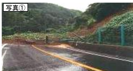
江津市黒松町の土砂崩壊 (S58. 7)