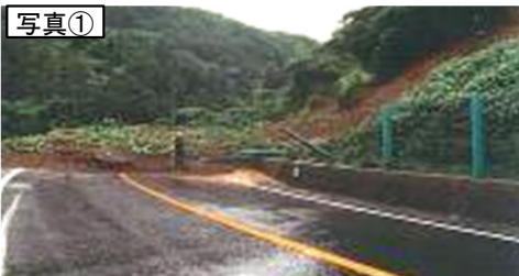
江津市黒松町の土砂崩壊(S58. 7)