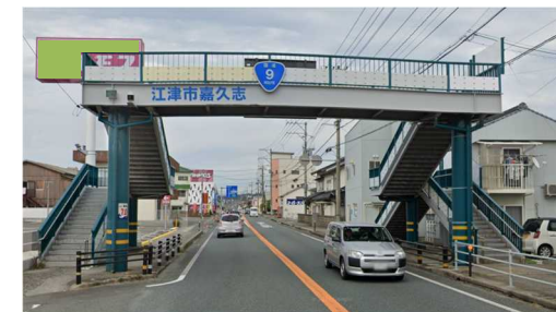
江津市嘉久志町 (歩行者道整備予定箇所)