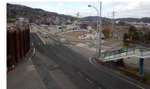
浜田市熱田町 (交差点改良・自転車歩行者道整備箇所)