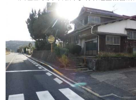
益田市神田町 (歩行者道整備予定箇所)