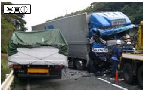
線形不良箇所による事故