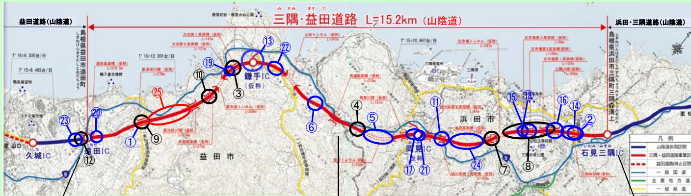
※この地図は、国土地理院長の承認を得て、国土地理院発行の2万5千分1地形図を複製したものである。(承認番号 令元情第 第328号)