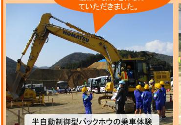
半自動制御型バックホウの乗車体験