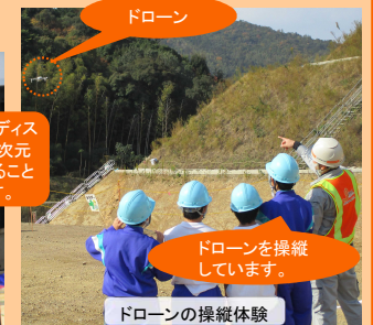
ドローンの操縦体験