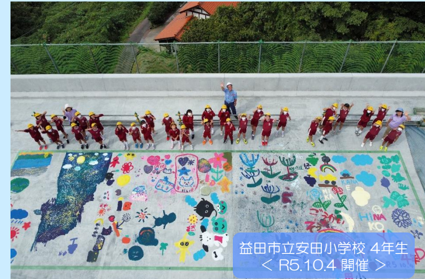
益田市立安田小学校 4年生 ＜ R5.10.4 開催 ＞