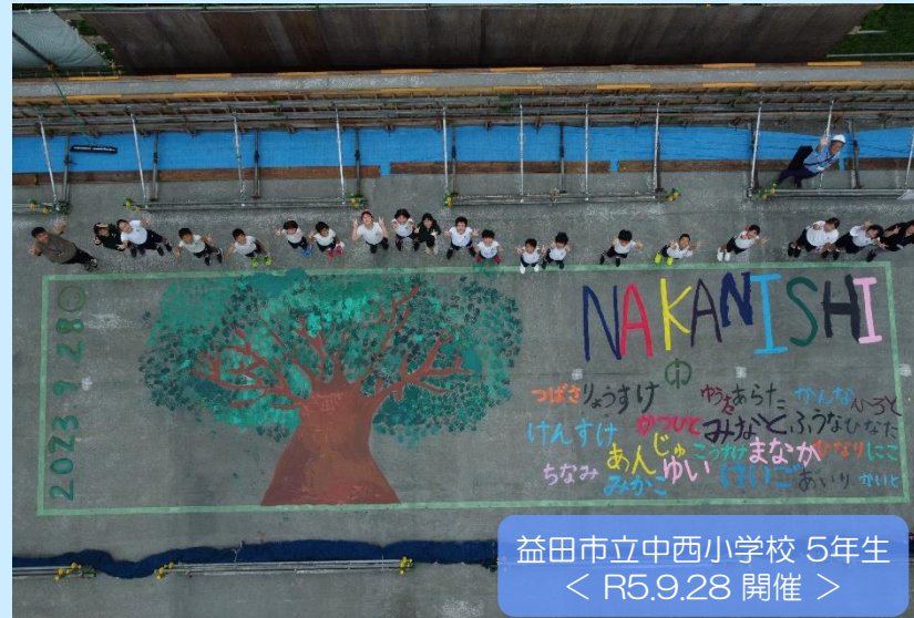
益田市立中西小学校 5年生 ＜ R5.9.28 開催 ＞