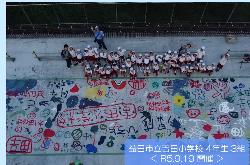
益田市立吉田小学校 4年生 3組 ＜ R5.9.19 開催 ＞