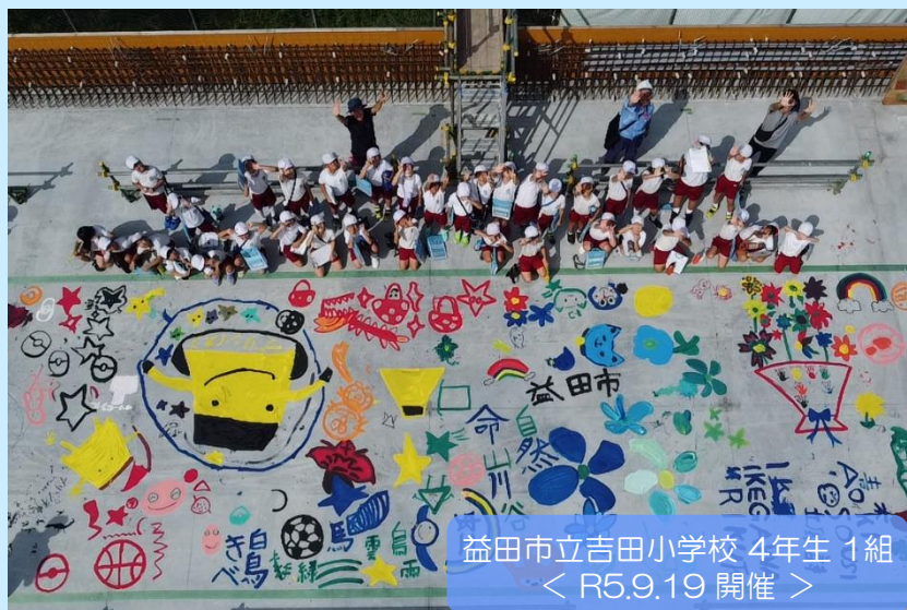
益田市立吉田小学校 4年生 1組 ＜ R5.9.19 開催 ＞