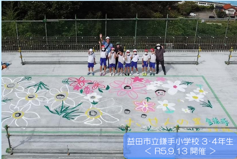
益田市立鎌手小学校 3・4年生 ＜ R5.9.13 開催 ＞