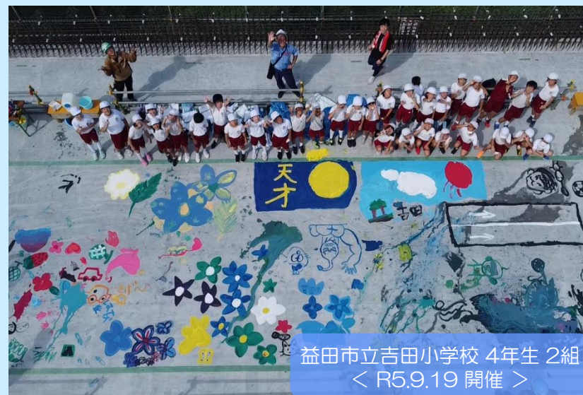
益田市立吉田小学校 4年生 2組 ＜ R5.9.19 開催 ＞