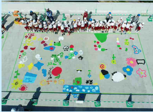
益田市立吉田小学校 4年生1組 ＜ R6.9.17 開催 ＞