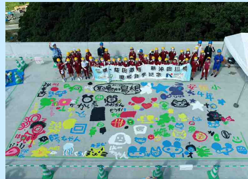
益田市立安田小学校 4年生 ＜ R6.10.9 開催 ＞