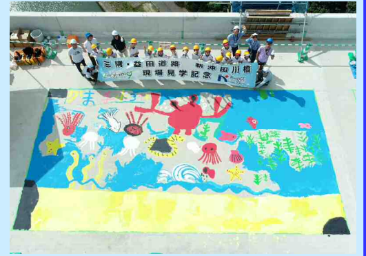
益田市立鎌手小学校 3、4年生 ＜ R6.9.18 開催 ＞