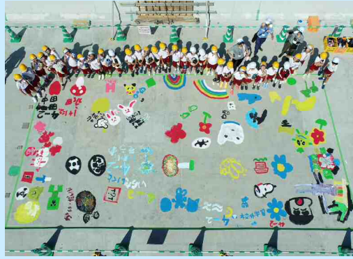
益田市立吉田小学校 4年生2組 ＜ R6.9.17 開催 ＞