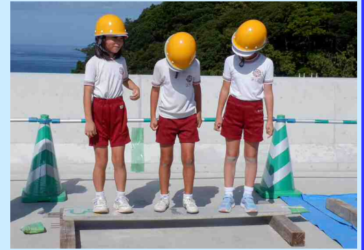
コンクリート板の強度の違いを体験している様子