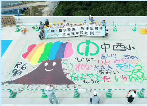
益田市立中西小学校 5年生 ＜ R6.9.19 開催 ＞