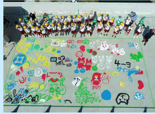
益田市立吉田小学校 4年生3組 ＜ R6.9.17 開催 ＞