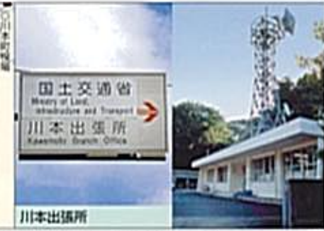
川本出張所 〒696-0003 島根県邑智郡川本町大字因原24 TEL0855-72-0431