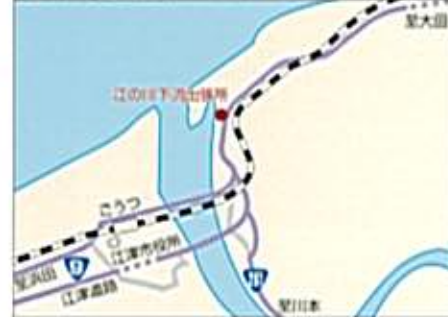
江の川下流出張所 〒695-0001 島根県江津市津津町2011-2 TEL0855-52-2926