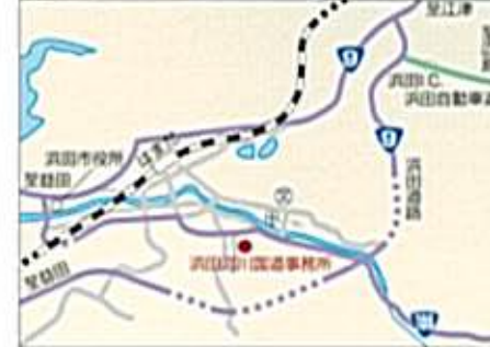
国土交通省中国地方整備局浜田河川国道事務所 〒697-0034 島根県浜田市相生町3973 TEL0855-22-2480