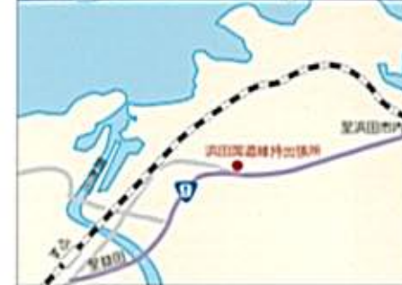
浜田国道維持出張所 〒697-1322 島根県浜田市日御寺地282-2 TEL0855-27-1133