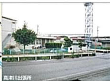
高津川出張所 〒696-0003 島根県益田市高津1丁目6-1 TEL0856-22-0533 益田国道維持出張所 〒698-0025 島根県益田市あけぼの西町19-1 TEL0856-22-1415 益田道路推進室 〒698-0025 島根県益田市あけぼの西町19-1(益田国道維持出張所) TEL0856-22-2333