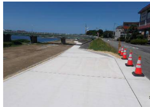
秋頃、車止めの設置が完了し、歩行者が安全に利用出来るようになった段階で開放する予定です。