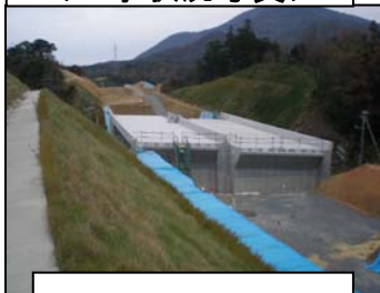
④中道跨道橋(仮称) 松江方面を撮影