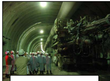
⑦塚ヶ原山トンネル(仮称) 松江方面を撮影