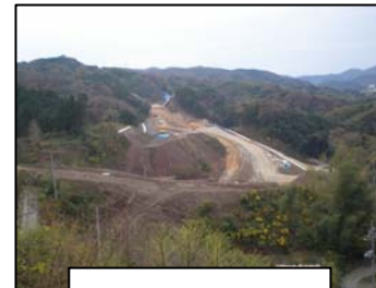
⑩熱田IC(仮称) 山口方面を撮影