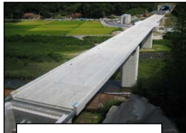
⑦周布川大橋(仮称) 松江方面を撮影