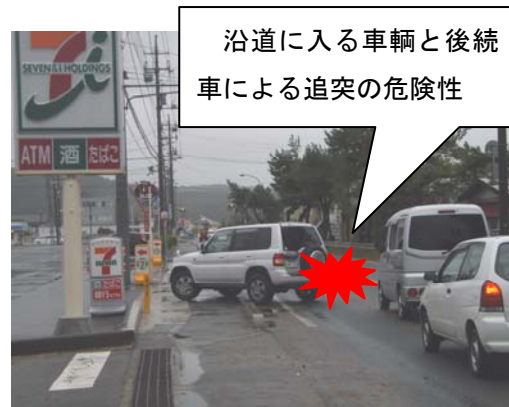
沿道に入る車輛と後続車による追突の危険性

また、歩行者が沿道にある店舗に向かうため、横断歩道の設置されていない箇所での横断が原因で人対車輛の事故も発生している状況です。