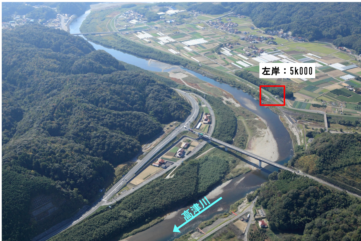
上空からのイメージ