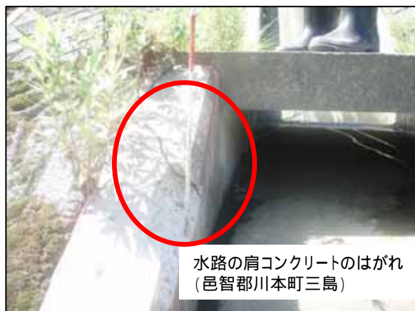
水路の肩コンクリートのはがれ (邑智郡川本町三島)