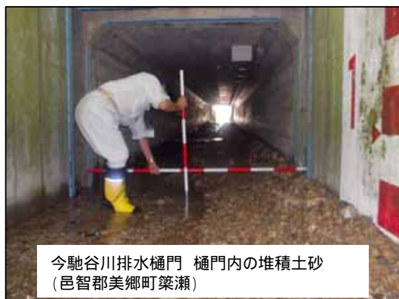
今馳谷川排水樋門 樋門内の堆積土砂 (邑智郡美郷町築瀬)