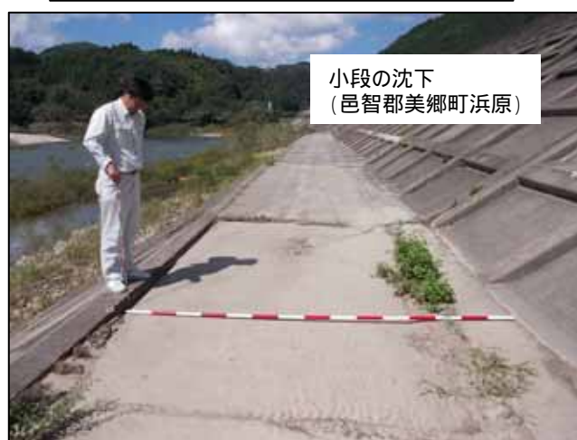
小段の沈下 (邑智郡美郷町浜原)