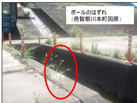
ポールのはずれ (邑智郡川本町因原)