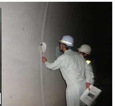
トンネル点検の実施例