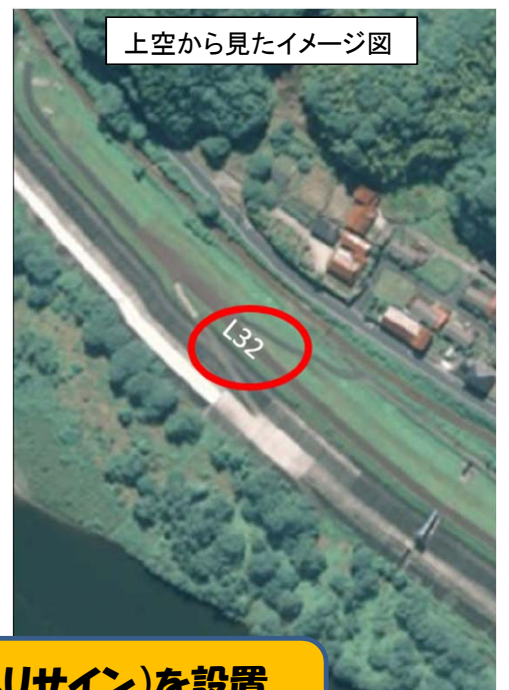
上空から見たイメージ図

災害発生時等に上空の防災ヘリコプターなどと位置を特定しやすくするため対空標示(ヘリサイン)を設置しました。速やかな人命救助や被災状況把握に役立てられます。上記写真は、江の川左岸32kmを標示。