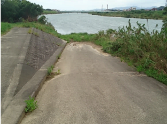
河川への転落の危険(益田市飯田町)

高津川で 9件 の変状が確認されました。主な内容は、河川への転落の危険がある箇所や、親水施設に流木がある箇所などでした。GW前までに河川への転落の危険がある箇所への立入防止措置や親水施設の流木撤去等を行います。