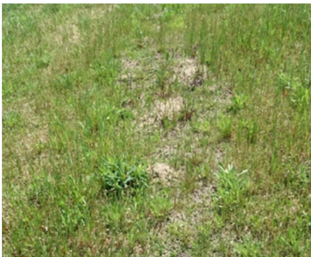
動物等による堤防の掘り返し(益田市安富町)

高津川で 100件 の変状が確認されました。主な内容は、コンクリート構造物のひび割れ等 60件 、その他(動物による堤防の掘り返しなど) 40件 でした。緊急的な修繕が必要となる箇所はありませんでしたが、確認された動物等による堤防の掘り返しについては、必要に応じて出水期までには対応し、コンクリートのひび割れ等については、引き続き経過観察を行います。