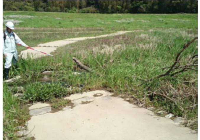
親水施設に流木(益州市内田町)