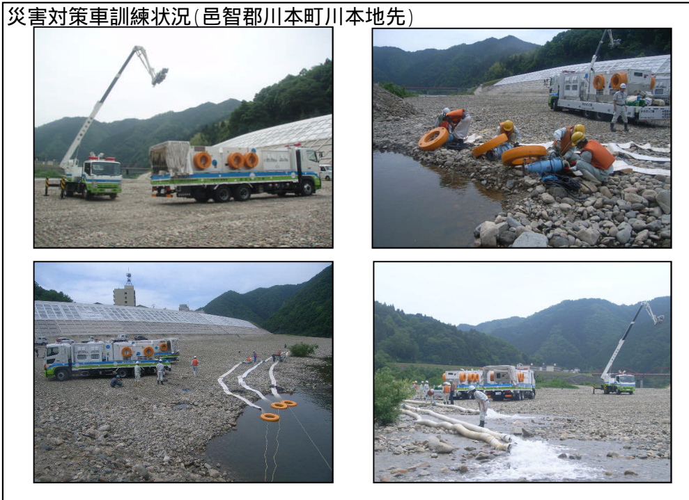
災害対策車訓練状況(邑智郡川本町川本地先)