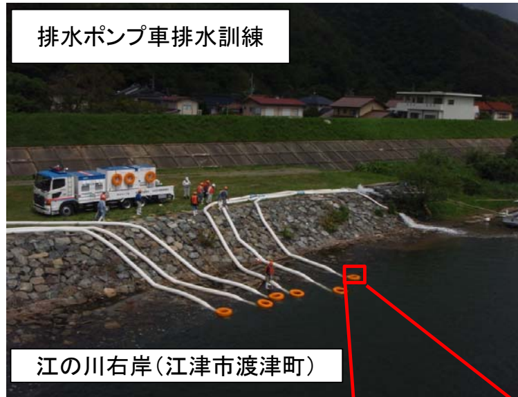
江の川右岸（江津市渡津町）