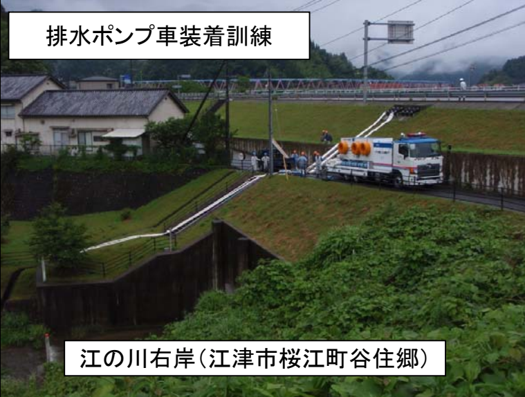
江の川右岸（江津市桜江町谷住郷）