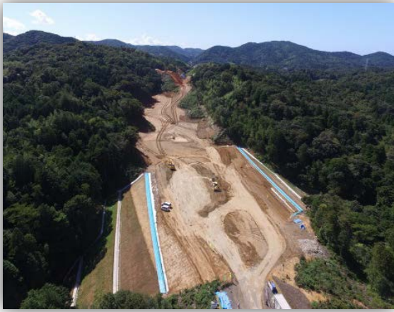
工事現場の状況 （ドローンによる空撮写真） ※令和元年9月末撮影