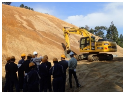
昨年の現場見学状況