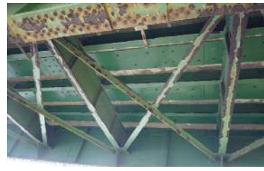
（桁の損傷（腐食）状況）

※気象状況及び調査の進捗により規制期間が変更となる場合もあります。 ※規制中は、誘導員の指示や工事看板等に従い注意して走行してください。 ※足場撤去時についても、同様の規制を行う予定です。