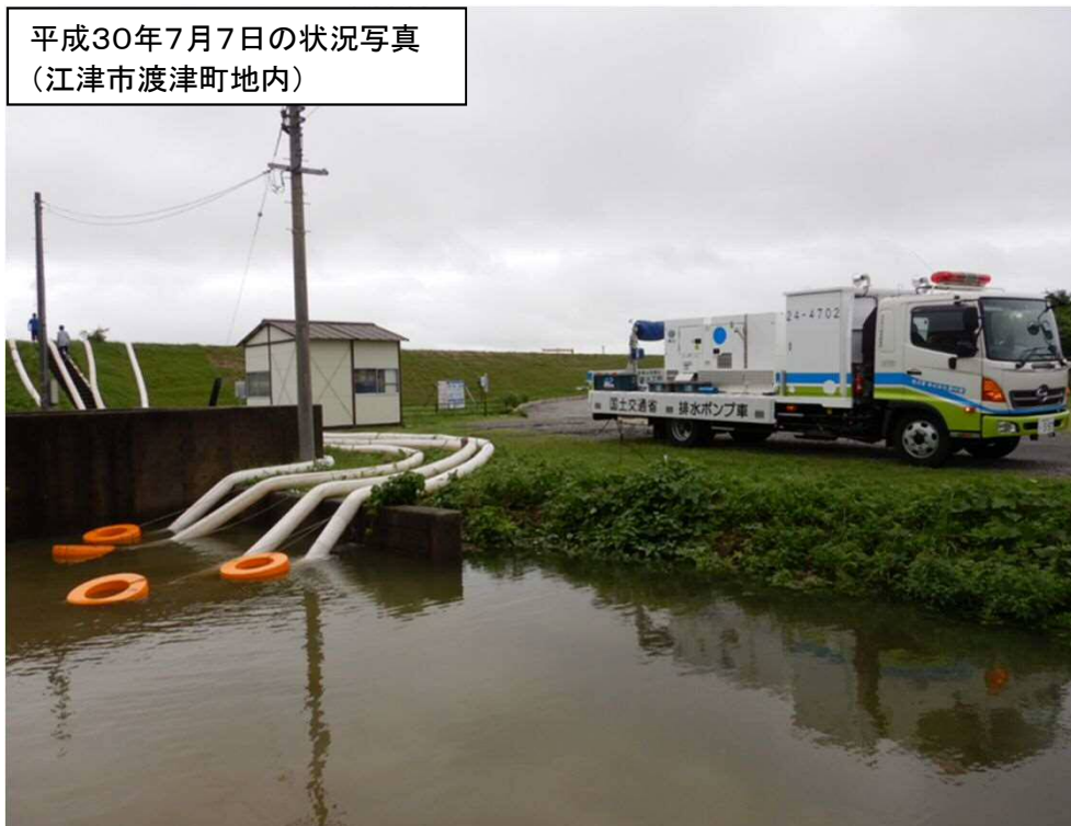
平成30年7月7日の状況写真 (江津市渡津町地内)