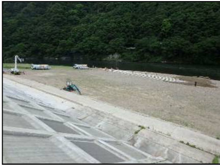
訓練状況(邑智郡川本町川本地先)