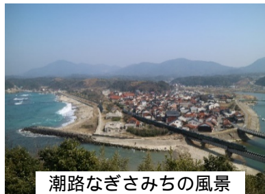
潮路なぎさみちの風景